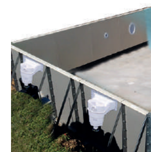
Structure d'une piscine Aquilus avec jambes de force « échelle »